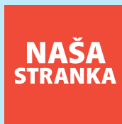
33. Amel Balić